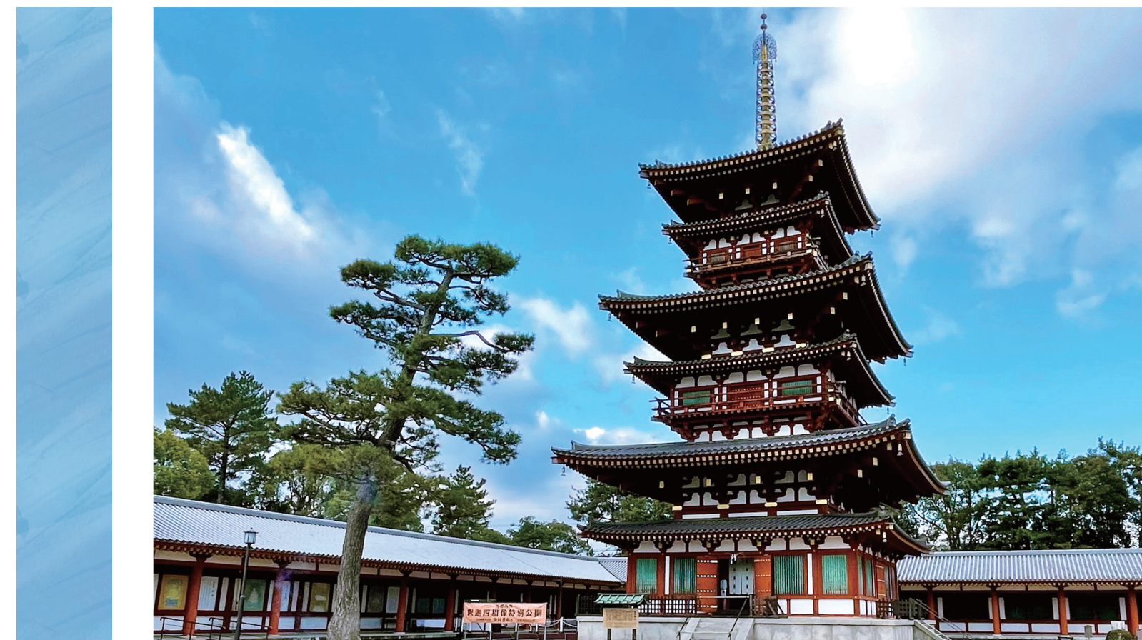
撮影地：薬師寺東塔